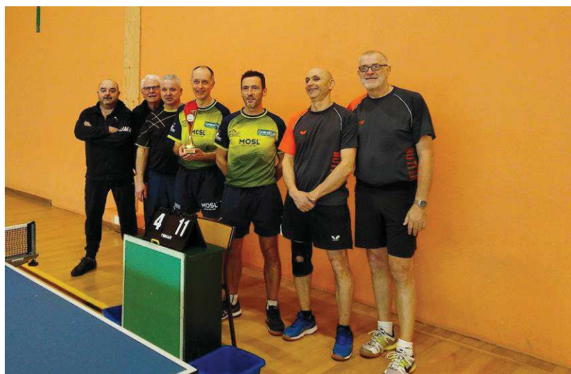
Manom JS, vainqueur du Tableau B

Le tour final, prévu début mai à Valenciennes a été annulé.